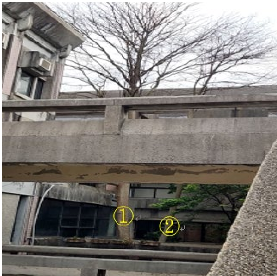
人社院防水修繕2期工程