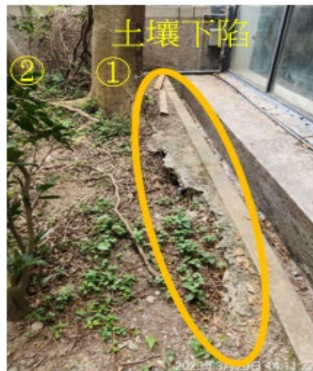
樹木周邊土壤下陷