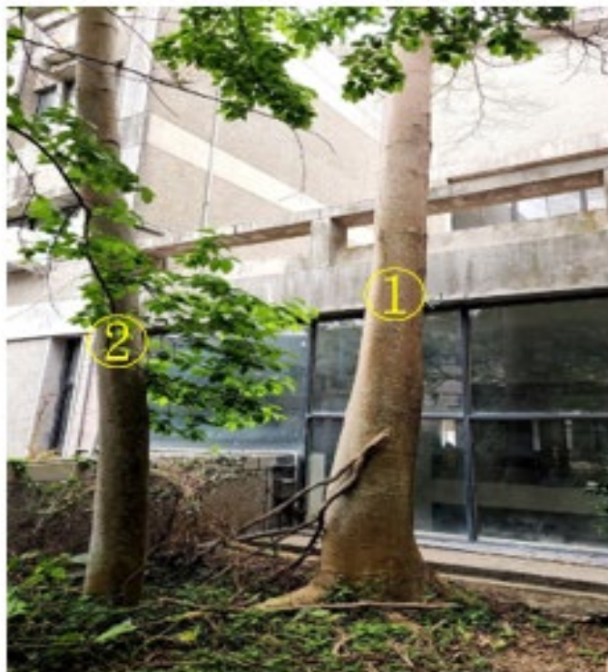
位置靠近建築物外牆