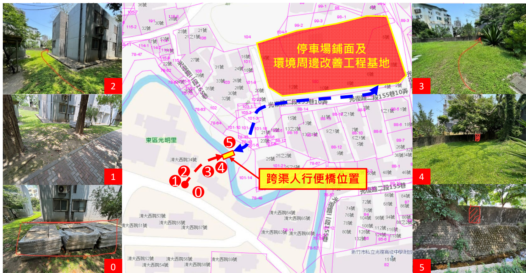
停車場鋪面及環境周邊改善工程