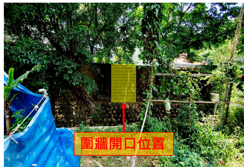
校外側圍牆現況 (光復路二段155巷10弄)