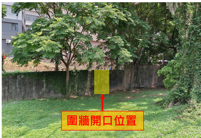
校內側圍牆現況 (西院35號後方草坪區)